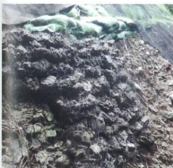
被災箇所の補修用「ストーンバック」

による地域再生や活性化の支援を目的に設立した会社。太陽光や水力、地熱、バイオマスなどの再生可能エネルギーの設計業務、送電設備に関わる業務支援、野菜ハウスの企画、設計、重曹を使った環境に優しい雑草防除法インターレジェンス工