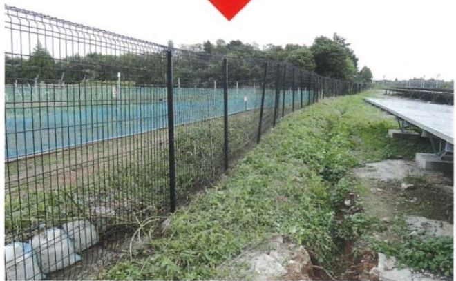
【インターレジェンス工法】

による地域再生や活性化の支援を目的に設立した会社。太陽光や水力、地熱、バイオマスなどの再生可能エネルギーの設計業務、送電設備に関わる業務支援、野菜ハウスの企画、設計、重曹を使った環境に優しい雑草防除法インターレジェンス工